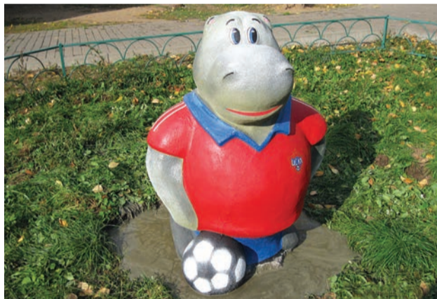
◆ Можайское шоссе, д. 70