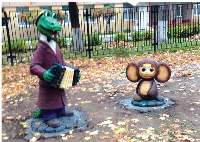
◆ Улица Молодежная, д. 1-3