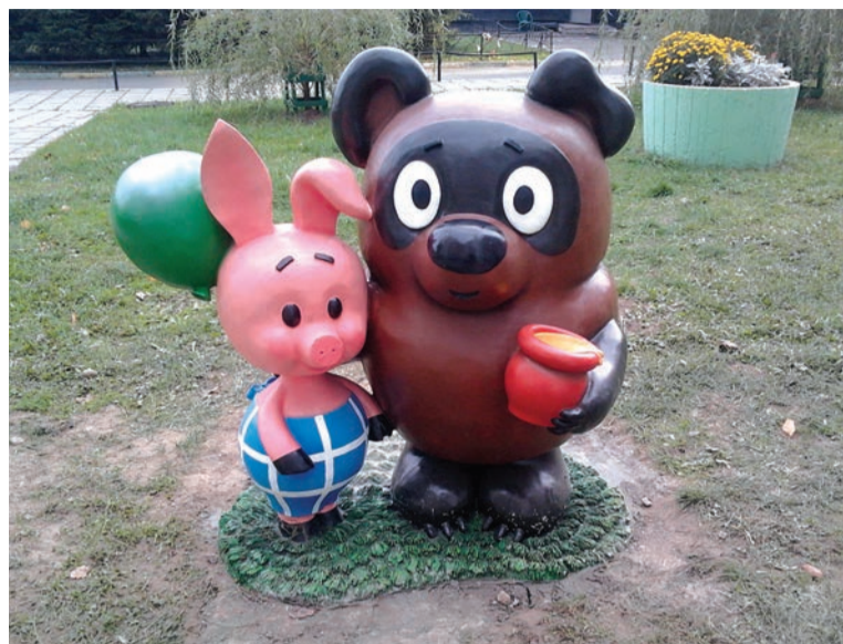
◆ Улица Маршала Жукова, д. 40