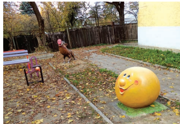
◆ Немчиновка, Советский проспект, д. 4