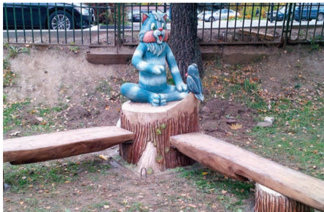
◆ Детская площадка у ГДК «Солнечный»